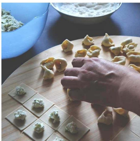
TRANSFORMACIÓ DEL PRODUCTE AGROALIMENTARI (150H)