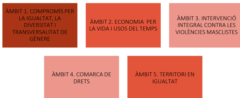
GRÀFICA 1. ÀMBITS O EIXOS ESTRATÈGICS DE TREBALL PREVISTOS EN EL PLA DE POLÍTQUES D'IGUALTAT DE GÈNERE I DIVERSITAT DE LA COMARCA DEL BAIX CAMP